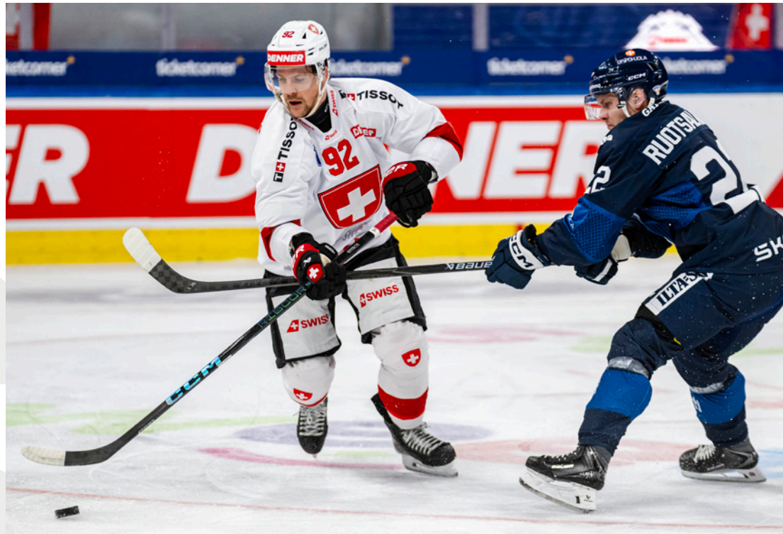
SWISS Ice Hockey Games, Suisse-Finlande, décembre 2025 Zurich

ceux qui investissent plusieurs milliers de francs dans un équipement de qualité, tout en restant plus réservés lorsqu'il s'agit du suivi de leur propre état physique. Ce alors qu'une approche préventive serait déterminante pour prévenir les blessures et maintenir durablement la performance. Il voit là un fort potentiel de développement, tant dans la collaboration interdisciplinaire que dans la prise en charge par les assurances maladie.